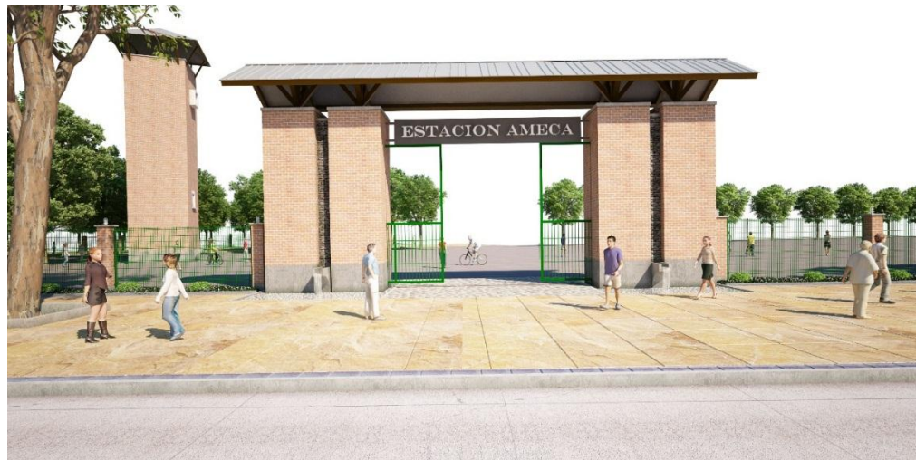
Parque La Estación – SEDEUR & DGOPPT.2012