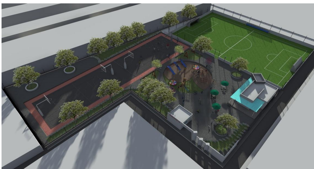
Parque Recreativo Jardines de Guadalupe – DGOPPT.2012