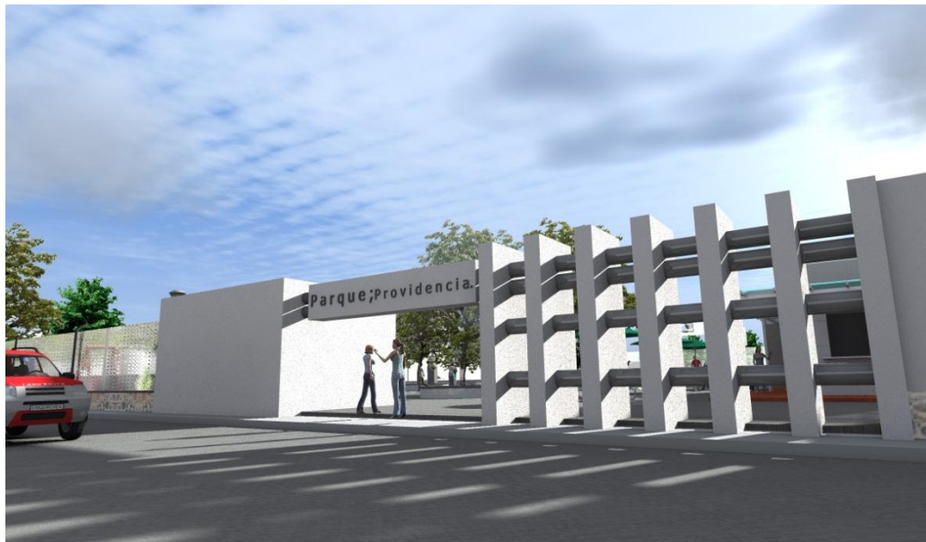
Centro Deportivo Providencia – DGOPPT.2012

La instrumentación efectiva del PLAN DE DESARROLLO DEL MUNICIPIO DE AMECA requiere mantener el proceso de planificación en marcha, identificando nuevos temas críticos y estrategias, según cambien las condiciones del entorno y se constatare la evolución favorable de la región, y arrancando nuevos proyectos según la disponibilidad de recursos.