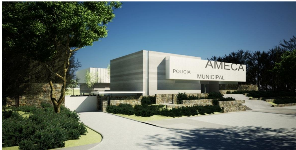
Central de Policía Regional – Secuencia Studio & DGOPPT.2012