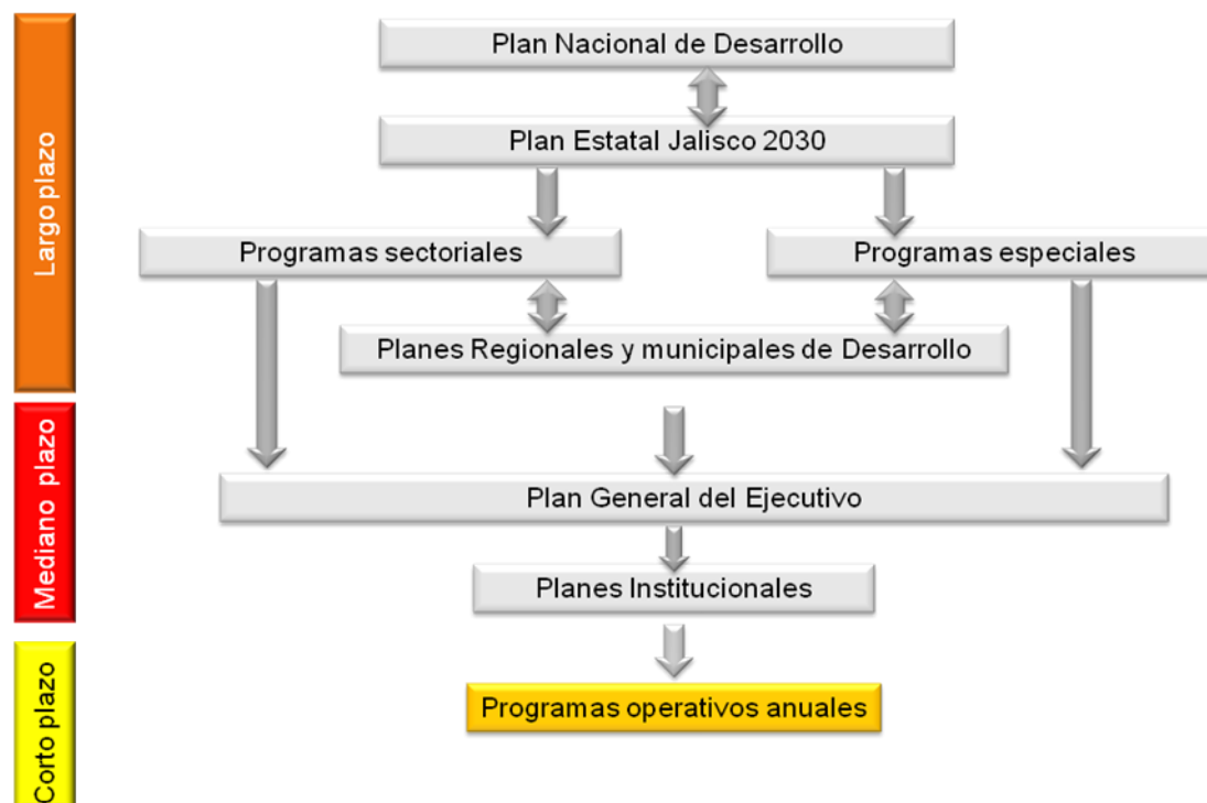
Figura 1.2 Vinculación de los instrumentos de planeación