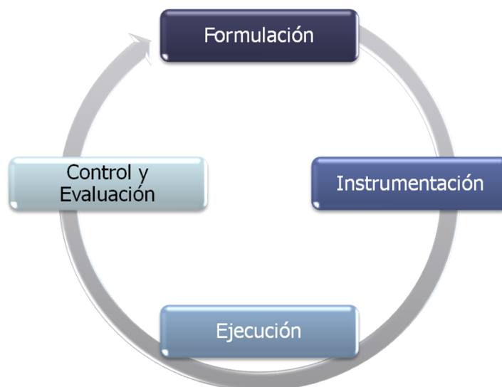
Figura 1.1 Proceso de planeación