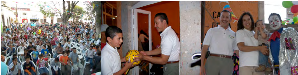
Festejo del Día del Niño con un Monto total de $66,650.00