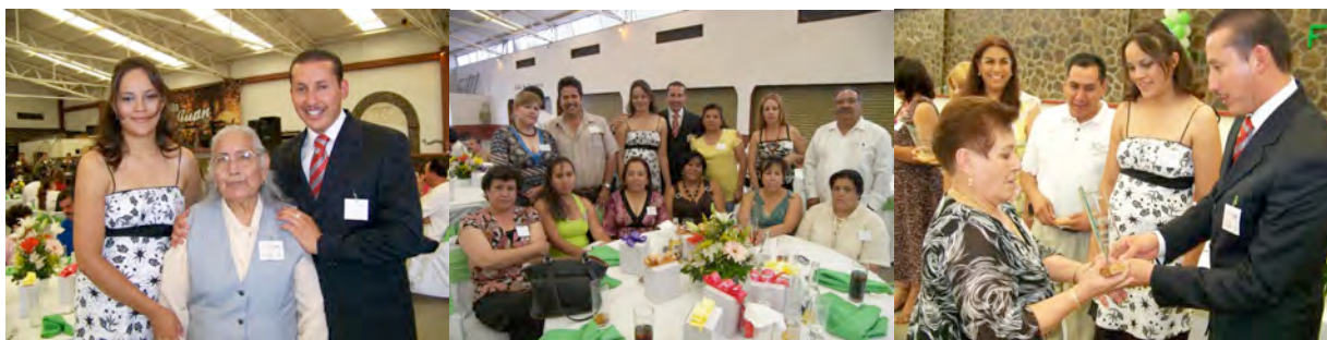
Festejo del Día de la Madres con monto Total de $132,562.00