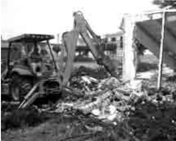
Demolición del Centro de Salud

Colonia San Gabriel, Santa Cecilia, Solidaridad, Luis Donaldo Colosio, Javier García Paniagua, Juan Gil Preciado, Moisés Quezada y San José Buen Agua, ésta última en coordinación con la Procuraduría de Desarrollo Urbano del Estado de Jalisco.