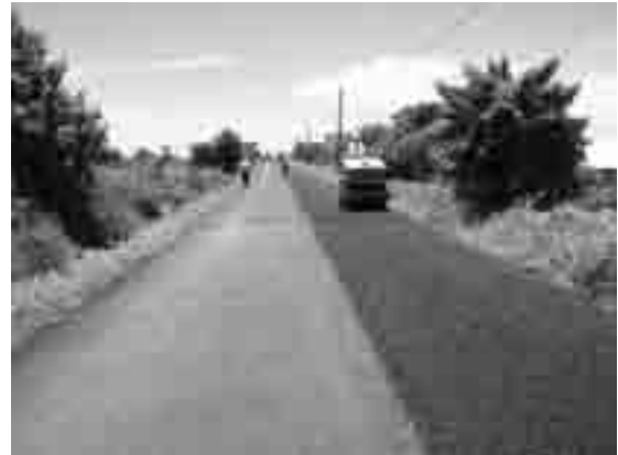
Elevación y asfaltado camino a Charapuato