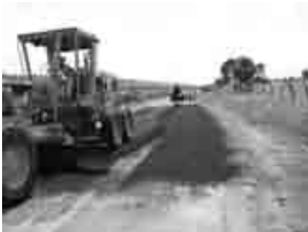
Bacheo mayor camino a Buenos Aires