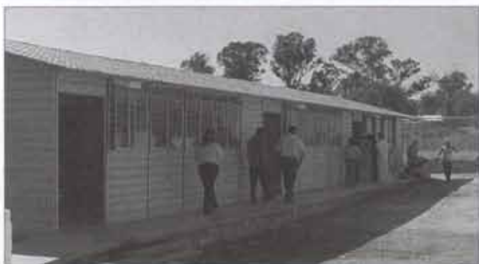
-Preescolar en el Fraccionamiento "Rinconada las Lomas" Concluido al 100%

Gracias a la donación de los terrenos propuestos por el Presidente Municipal y avalados por el cuerpo de regidores en el Ayuntamiento Municipal 2007-2009 en los términos de la figura legal del comodato a la Secretaría de Educación de Jalisco, promovimos la construcción de los siguientes planteles educativos: