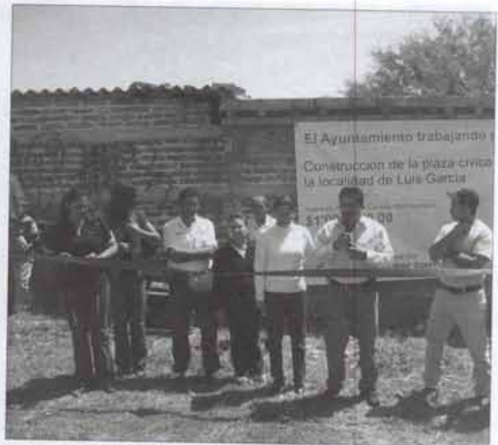
-Construcción de Plaza Cívica en la localidad de "Luis García" 2,177.40 m 2