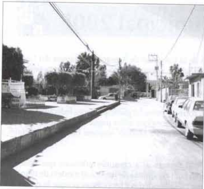
-Rehabilitación de la carpeta asfáltica en vialidades "Santa Rosa" 8,399.20 m 2