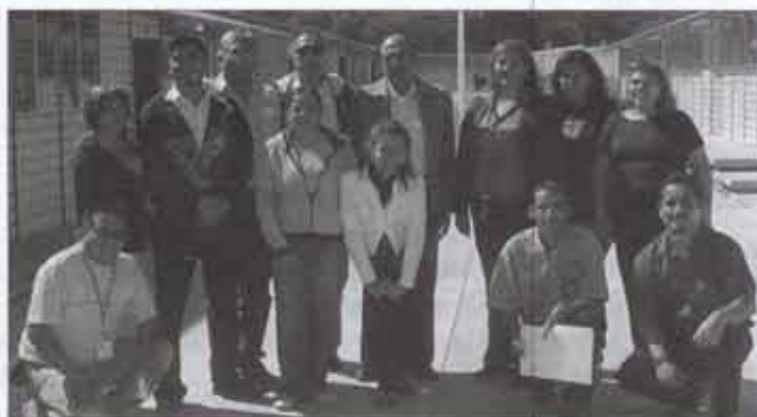
- Primaria en Fraccionamiento "Rinconada las Lomas" 95% de avance