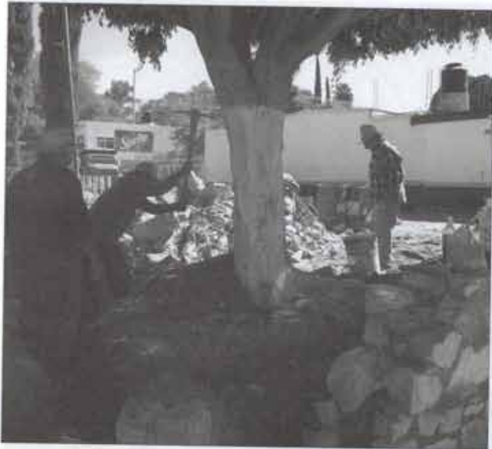
-Remodelación de la Plaza Principal en la localidad de "Buenavista" Con módulo de baños de 40 m 2