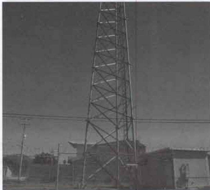
•Electrificaciones la localidad de "Lomas de Atequiza" 2,400 ml.