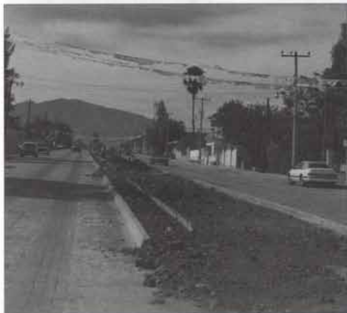
•Rehabilitación del ingreso en la Av. Hidalgo en la localidad de "la Capilla", 700 ml Avance: 40%