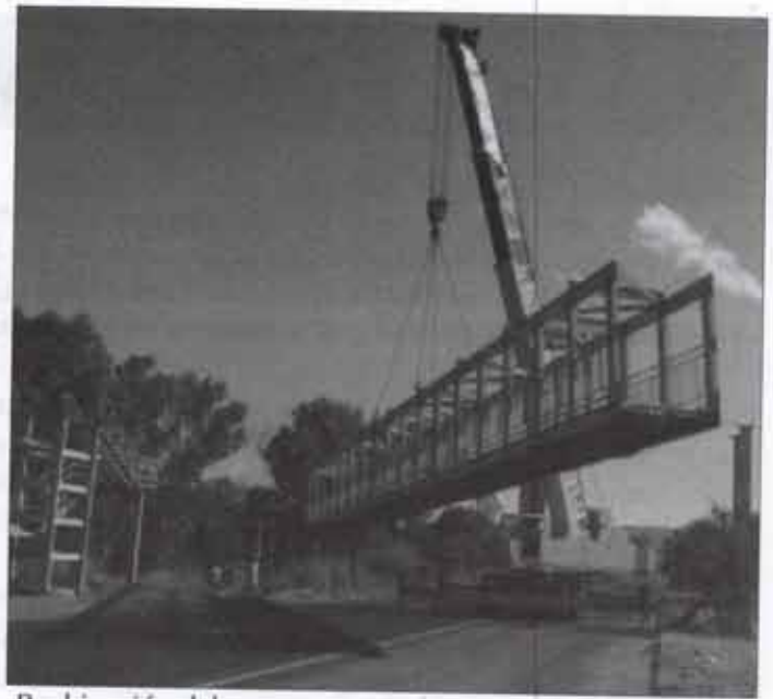
-Reubicación del puente peatonal en la localidad de "Buenavista" Concluido