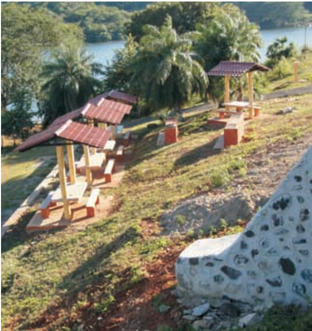
Electrificación Núcleo Turístico