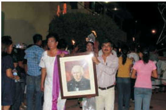
Tradicional paseo de las antorchas

Se celebra el día mundial del medio ambiente convocando a niños a un concurso carteles, bajo los temas: Cambio climático, La basura y El agotamiento del agua