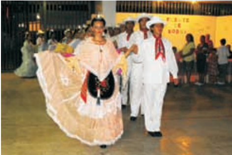
Inauguración del teatro del pueblo

El Teatro del Pueblo logró su Sexta edición con notable éxito. En el presente año se destinaron $ 280,000.00 para la contratación del elenco artístico, con una afluencia de aproximadamente 6,000 asistentes.