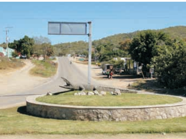
Glorieta y escultura en la Cumbre Costo total de 169 mil 310 pesos