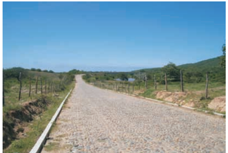
Empedrado Ecológico en Cruz de Loreto Inversión de 5 millones 450 mil pesos