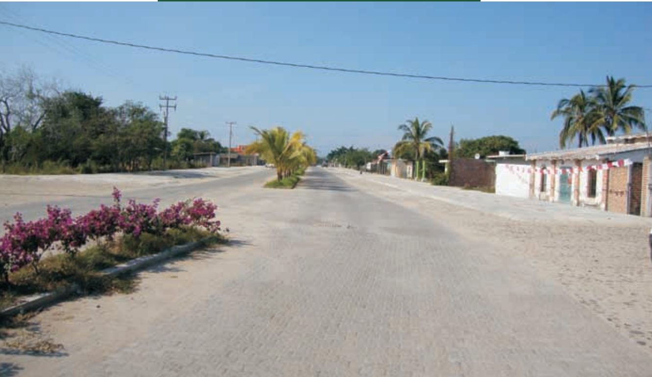
Adoquinado en Av. de Ingreso a Cruz de Loreto Inversión de 6 millones 528 mil pesos